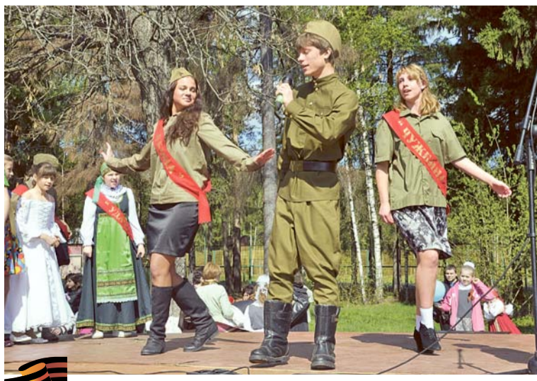
Литературно-музыкальная композиция, посвященная Дню Победы снискала многочисленные аплодисменты зрителей