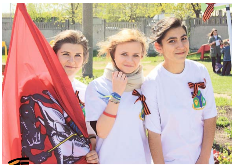
Подрастающее поколение — с благодарностью ветеранам за чистое небо над головой!