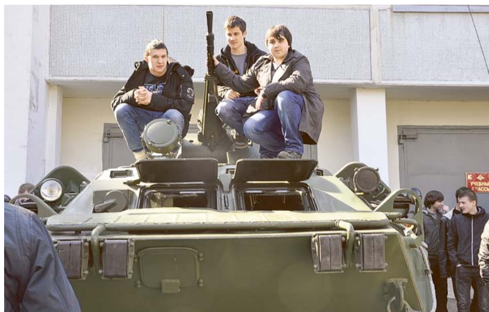
«Экипаж» машины боевой — будущие новобранцы из Восточного на Дне призывника