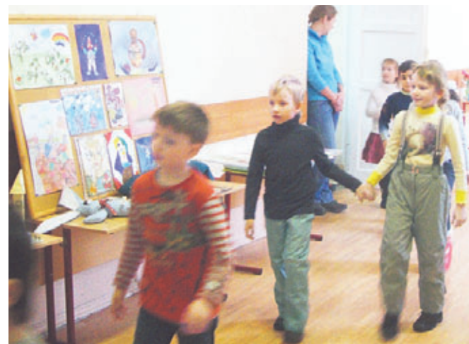
Ребяташки с интересом знакомилась со школой

Желаем вам крепкого здоровья и благополучия, терпения и оптимизма, успехов в вашем нелегком, но таком важном труде!