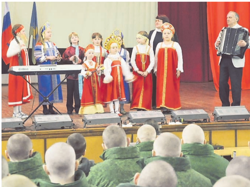
Юные дарования из ДМШ № 101 исполнили музыкальные композиции, подобранные специально к празднику Дня защитника Отечества

— Мы хотим, чтобы такие встречи стали доброй традицией муниципалитета Восточный.