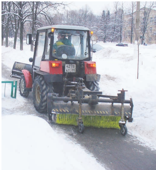
Идет уборка территории