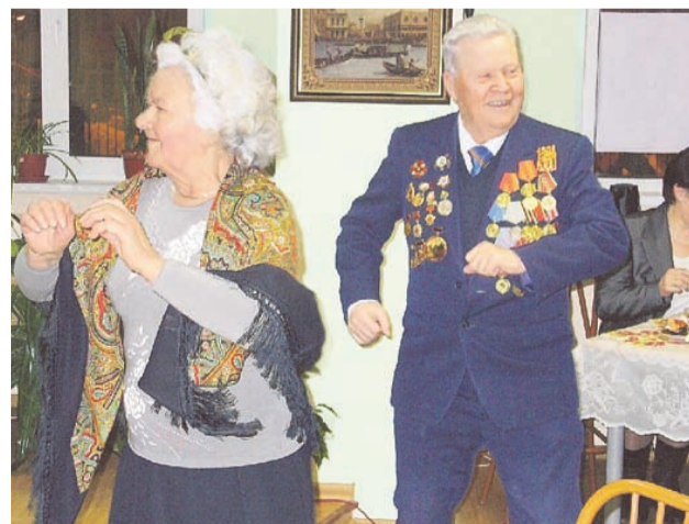
Наши ветераны умеют веселиться!