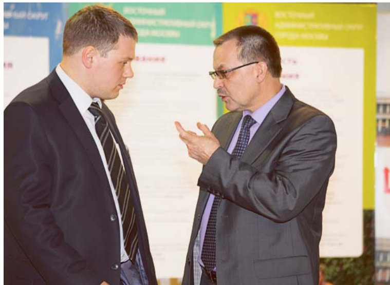
Перед началом работы актива

© Издательская группа Редакция газеты «Сокольники и весь Восточный округ» — эксклюзив для районных газет «Богородские Ведомости», «Будни Сокольников», «Вешняки», «Наш район Восточный», «Вести Метрогородка», «Перово. События и Люди», «Соколинка-информ».