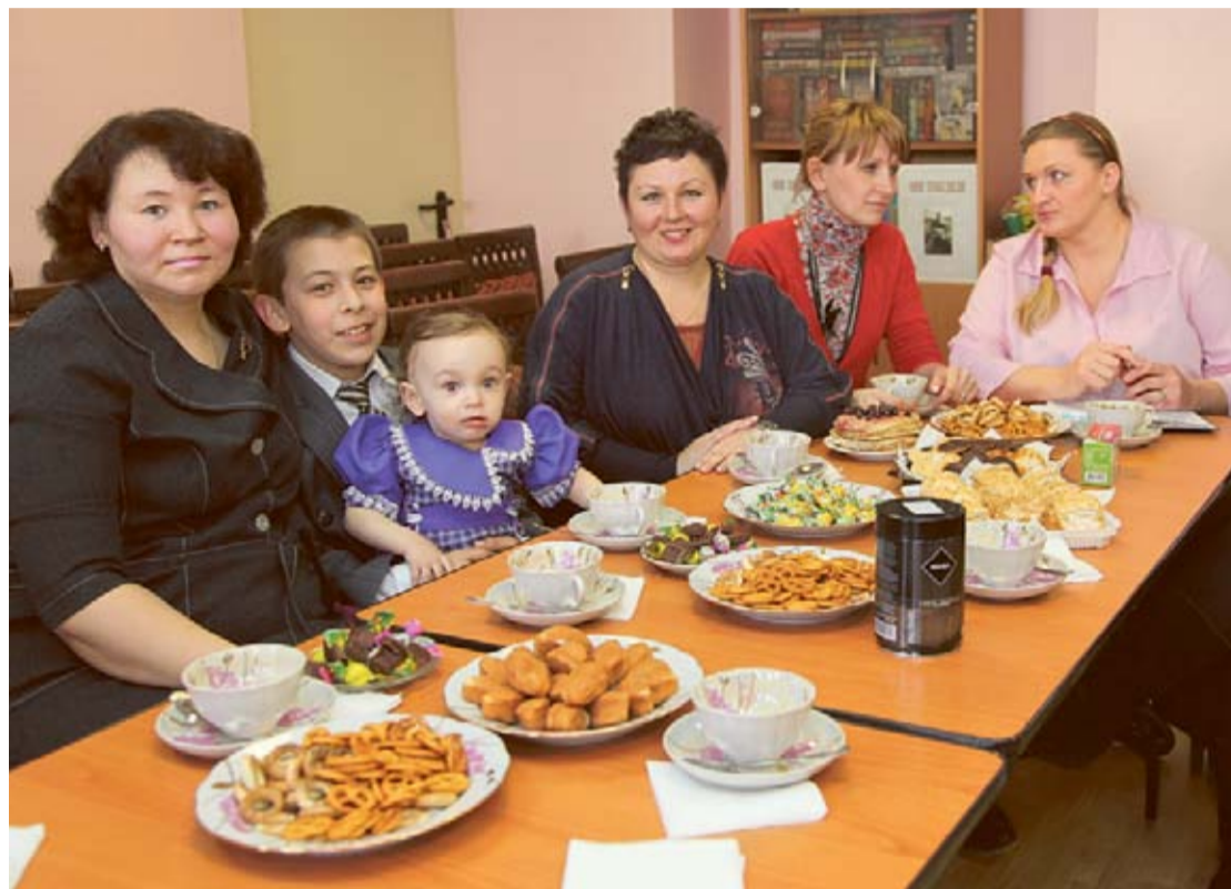
Доволен был каждый