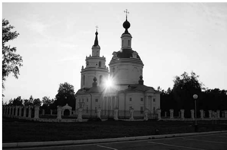
Церковь Успения Пресвятой Богородицы в Болдино

— Все оно отдавалось сыночку — кормление, пеленки... Но в то же время наблюдать за ним было интересно, в первый год он так быстро рос и почти каждую неделю на-