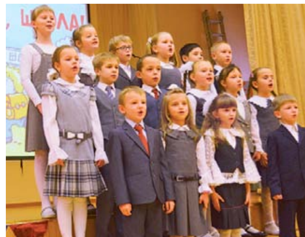
Концерт «Школьная регата» очаровал зрителей