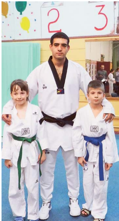
Тренер и его ученики