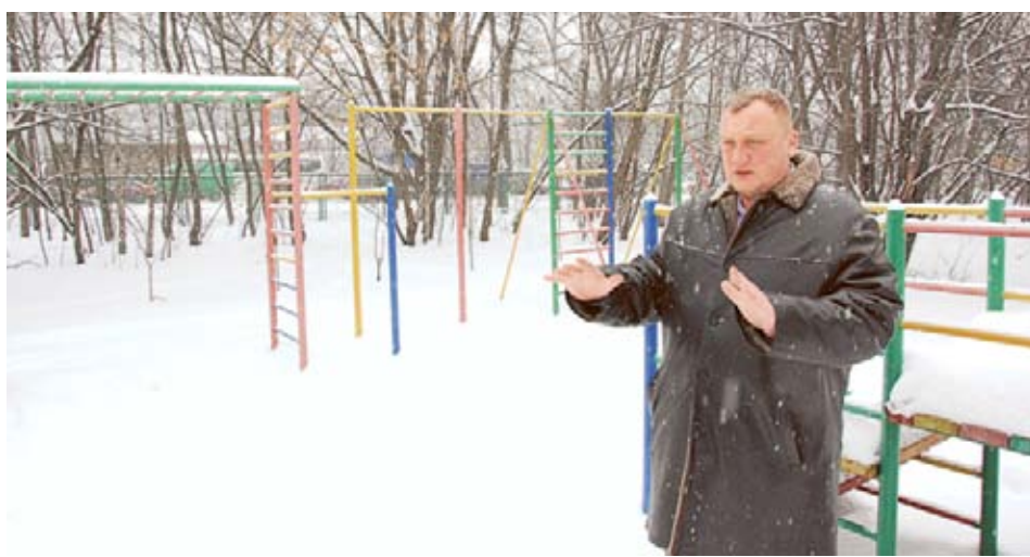
Летом эту территорию комплексно обустроят

— оформление и выдачу Удостоверения многодетной семьи города Москвы и его дубликата можно подать в электронном виде через «Личный кабинет» Портала государственных услуг города Москвы, доступный в сети Интернет по адресу: rgu.mos.ru