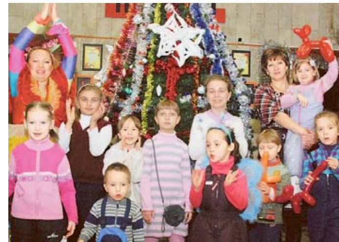
Главное — иметь верных друзей