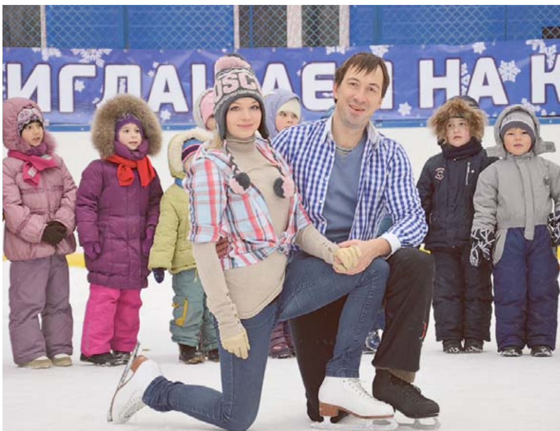
Приглашаем на каток!