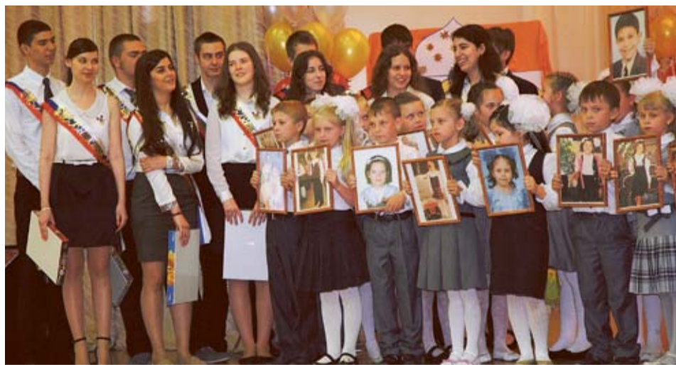
Первоклашки вышли к выпускникам с их снимками одиннадцатилетней давности

Приятный сюрприз выпускникам преподнесли первоклашки: с их снимками одиннадцатилетней давности вышли на сцену и про каждого прочли стихи, затем вручили фотографии виновникам торжества. А те порадовали малышей маленькими подарками. В свою очередь одиннадцатиклассники подготовили концерт, в котором хотели донести до зрителей давно известную истину: школьная пора — прекрасное время! Они пели, тан-