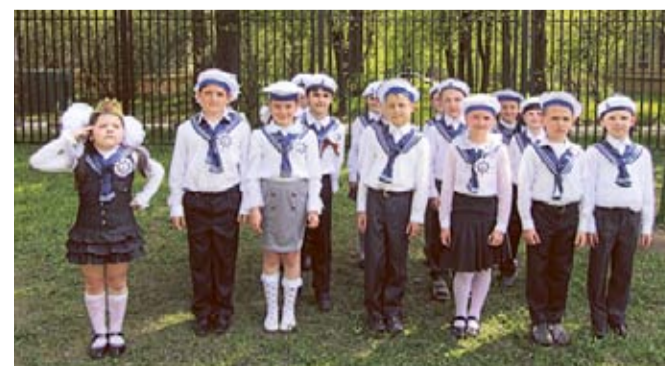
«Юнги» показали класс