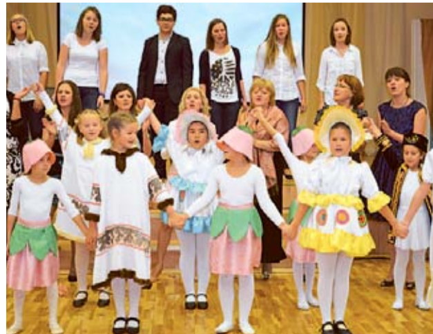
Праздник в школе прошел на одном дыхании