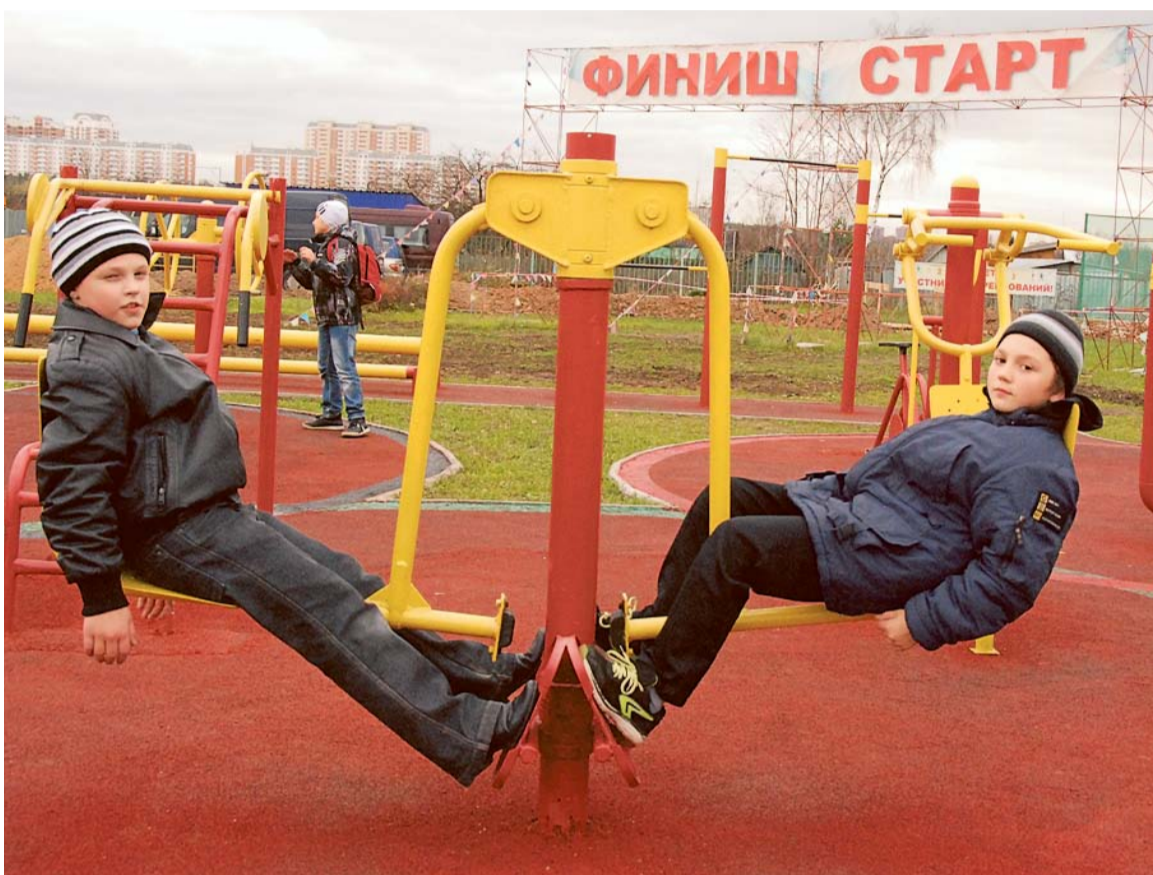
Ребятам из Восточного есть чем заняться в свободную минуту