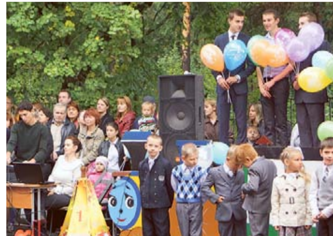
Для школьников устроили праздник