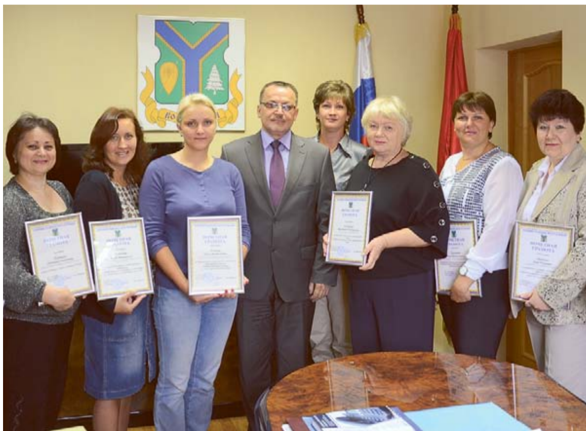
Виктор Иванович тепло поздравил награжденных